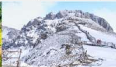
ภูเขาหิมะสี่อ่า