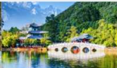
สระมิงกรดำ