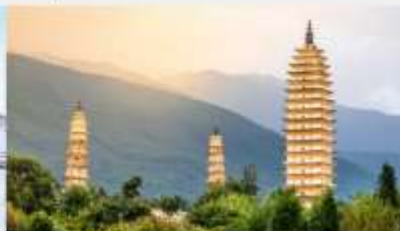
เจดีย์สามองค์

*ทางบริษัทฯ ขอสงวนสิทธิ์ในการสลับโปรแกรมทัวร์ตามความเหมาะสมขึ้นอยู่กับสถานการณ์หน้างาน โดยคำนึงถึงผลประโยชน์ของลูกค้าเป็นสำคัญ