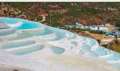
ระเบียงธารน้ำขาว "ไป๋สุ่ยโต"